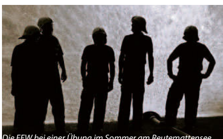
Die FFW bei einer Übung im Sommer am Reutemattensee

Das Rathaus und der Bürgerservice bleiben am Freitag, den 10.05.2024 geschlossen.