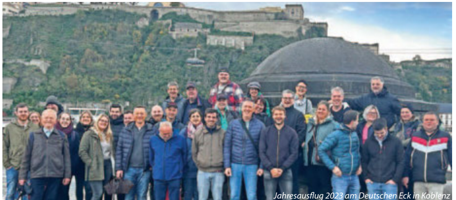
Jahresausflug 2023 am Deutschen Eck in Koblenz