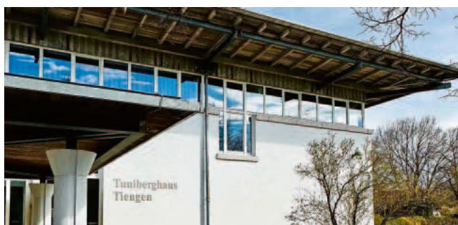
Wahlkreis 640-01 - Wahllokal im Tuniberghaus

Ihr Ortsvorsteher und Ihre Ortsverwaltung