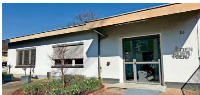
Wahlkreis 640-02 - Wahllokal im Rathaus Nebengebäude